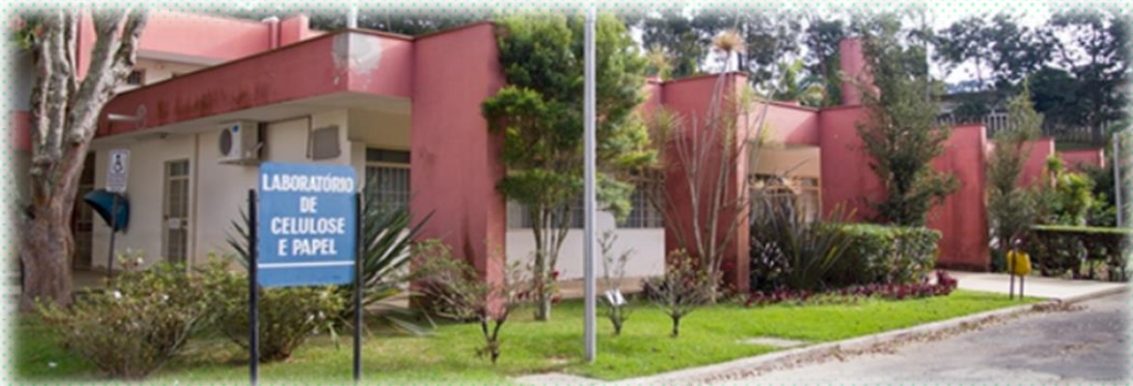
Laboratório de Celulose e Papel da UFV – Universidade Federal de Viçosa