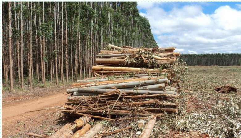
Pilhas de madeira e biomassa dispostas na beira da estrada florestal para secagem ao ar