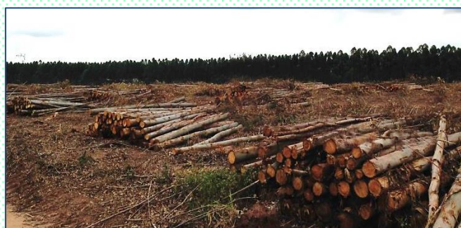
Biomassas florestais secando ao ar livre nas florestas

Algumas utilizações industriais são mais tolerantes em relação às variações no teor de umidade, como é o caso do setor de fabricação de celulose kraft, onde cavacos de madeira são impregnados com licóres alcalinos de cozimento, sendo que isso pode acontecer em diferentes e variados teores de umidade.