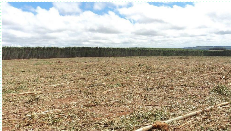
Resíduos da colheita secando sobre o solo do talhão florestal