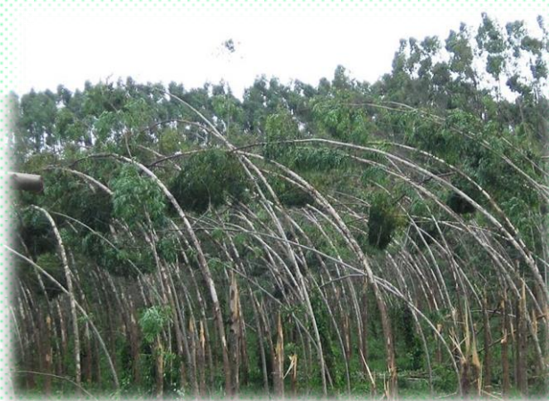
Ventos e seus efeitos na eucaliptocultura