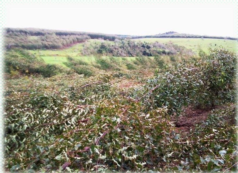
Árvores vergadas pelos ventos fortes

https://www.google.com.br/search?hl=pt-BR&site=img&tbm=isch&source=hp&biw=1093&bih=479&q=Ventos+%2B+%C3%81rvores+Quebradas+%2B+Eucaliptos&oq=Ventos+%2B+%C3%81rvores+Quebradas+%2B+Eucaliptos&gs_l=img.3...2361.4633.0.6274.3.3.0.0.0.298.763.2-3.3.0....0...1ac.1.51.img..3.0.0.aOg7aDtdFzQ (Imagens Google: Ventos + Árvores Quebradas + Eucaliptos)