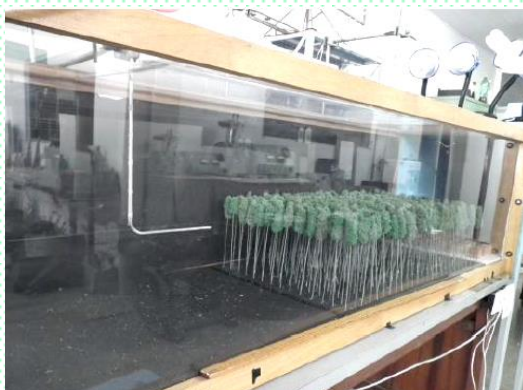
Teste do túnel de vento

São ainda possíveis estudos modelares de simulação espacial de florestas plantadas em túneis de vento laboratoriais. Diversos aspectos espaciais podem ser simulados e testados para se conhecer mais sobre as características dos povoamentos em relação aos ventos. Com esses testes, pode ser possível se entender melhor os efeitos das copas, espaçamentos, peso de água sobre as copas em dias de chuvas com ventos, etc.