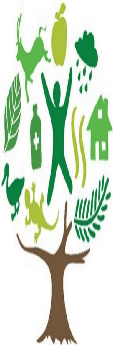
Uso da Terra no RS