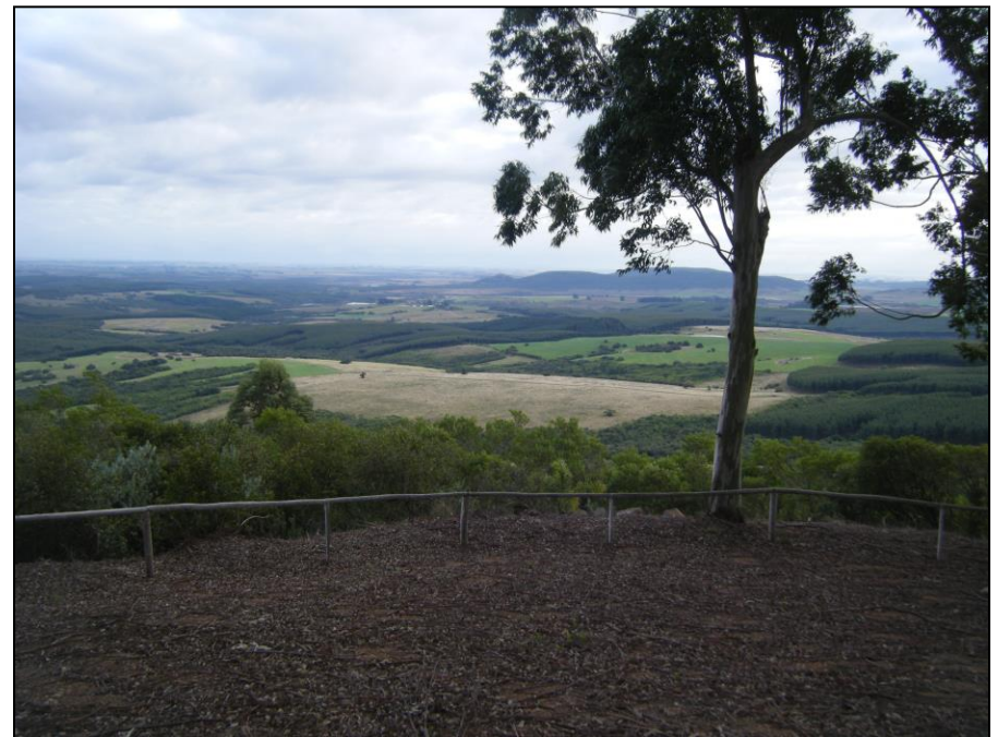
CERRO DO CHAPÉU