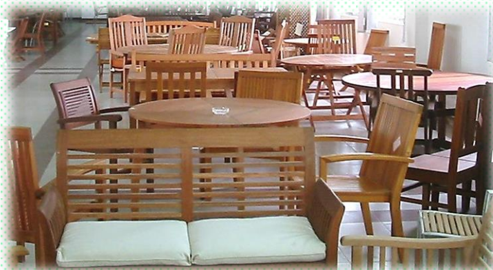
Madeiras de alta beleza e valor agregado obtidas de eucaliptos Uma das áreas de forte atuação do engenheiro Claudio Renck Obino