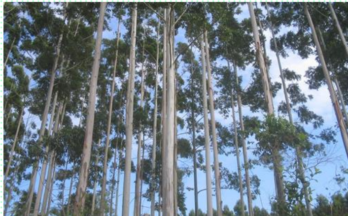
Florestas plantadas certificadas Uma das áreas de forte atuação do engenheiro Claudio Renck Obino

http://www.ipef.br/publicacoes/seminario_serraria/cap14.pdf