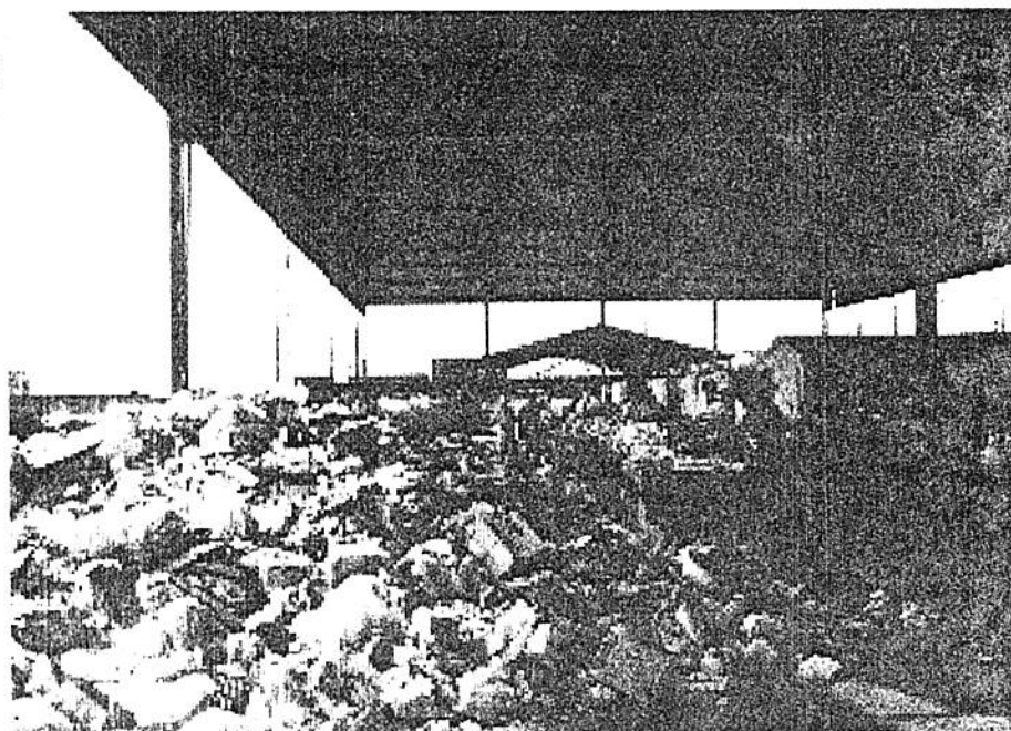
Galpão de chegada do lixo para triagem

onde passa a gerar maior quantidade de lixo em relação à sua situação anterior. No Brasil, as migrações têm sido fundamentais no processo de crescimento demográfico das cidades. Hoje, de cada 100 brasileiros, 75 moram em cidades 1 .