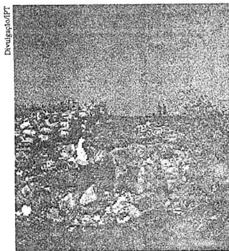
Catadores no lixo. Sacos de material separado para reciclagem

10. BARBOSA, G. Incineração (parte 4) . In: JARDIM, N.S. (Coord.) Lixo Municipal: manual de gerenciamento integrado . São Paulo: IPT/CEMPRE, 1995. Cap. 5 (IPT. Publ. 2163) ▲