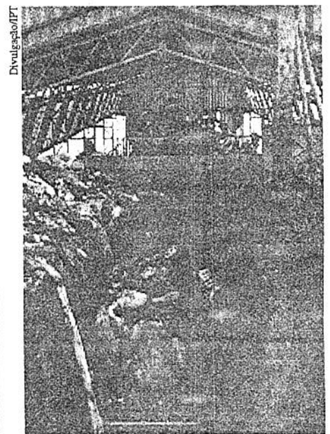
Entrada de lixo na esteira. Ao fundo, pessoal realizando a triagem

Segundo o sociólogo Daniel J. Hogan 8 , o número de habitantes no mundo é importante, mas a sua distribuição e padrões de consumo é mais ainda. Os 20% da população mundial dos países ricos junto com as frações de classe média e de elite dos países pobres consomem 80% dos recursos naturais do planeta e produzem 80% da poluição.